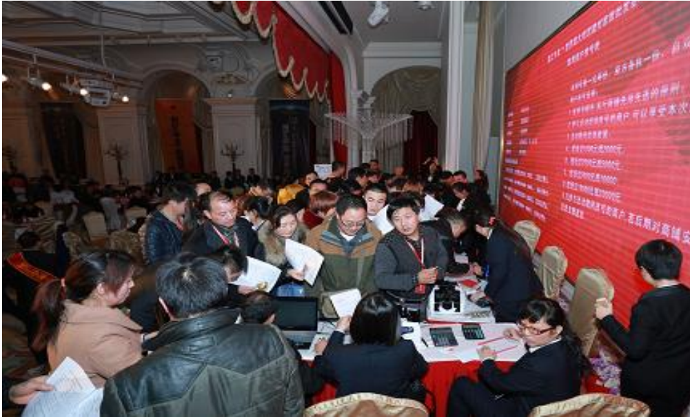
「大明宫建材家居基地招商发布会」招商反应热烈。